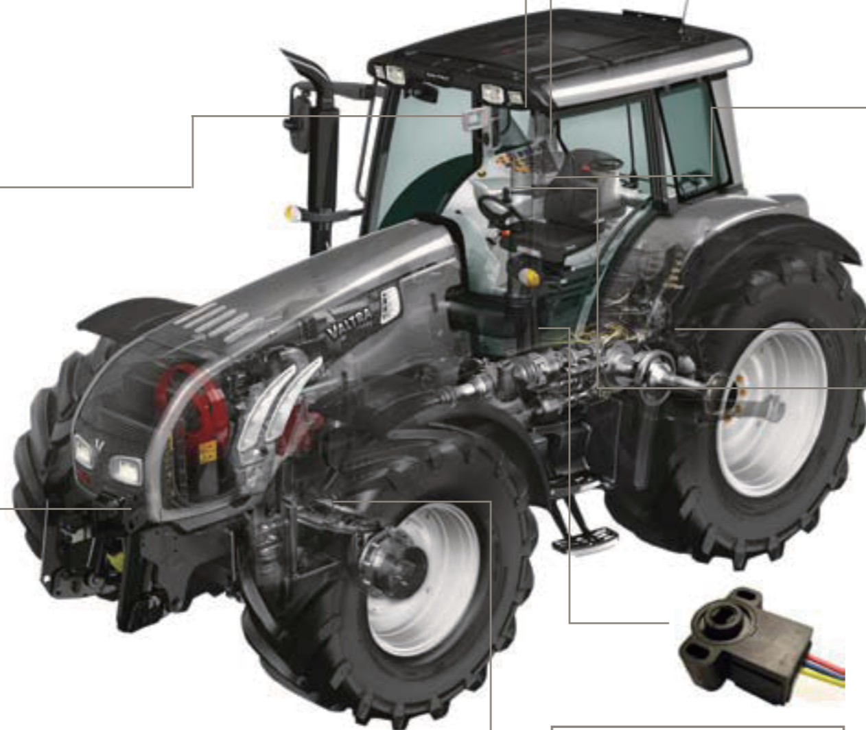
農業用トラクター Valtra社

IQANセンサはモバイルアプリケーションのために開発されており、マシン部の厳しい要求に適合します。